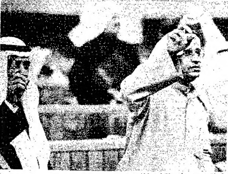
ناقص عضو واحد فقط... هكذا يشهد الربيعي والحمد!